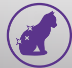
Iho + karva