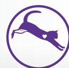
Sydän + lihas